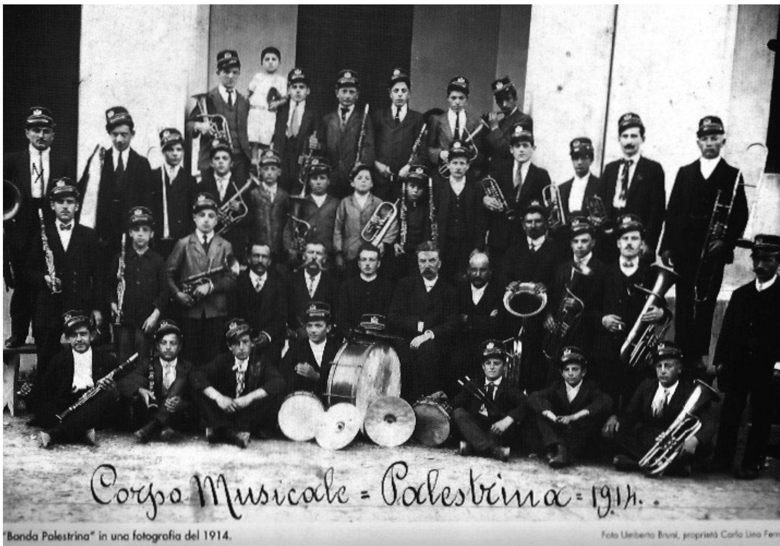
"Banda Palestrina" in una fotografia del 1914.